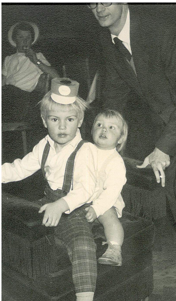
1956: Här verkar barnen åka i något slags källståg på inget mindre än våra punschen-möbler!