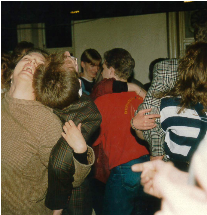
Och ett danstips – dansa baklänges!

B aklängesgasquen är kanske min favoritsittning på ÖG. Om du redan har börjat oroa dig över 2021 års utklädnad kommer här ett enkelt tips från 1990 – klä dig baklänges!